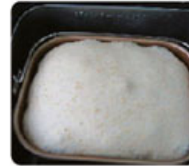
7. Вторая короткая расстойка теста