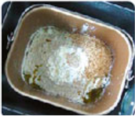
1. Все ингредиенты помещаются в хлебопечкарную форму

Вы будете приятно удивлены, какими огромными возможностями обладают современные хлебопечки торговой марки Endever! И в тоже время как просто ими пользоваться!