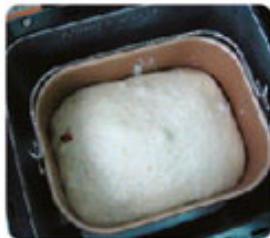
6. Обминка теста