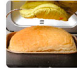
8. Выпекание хлеба