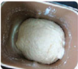
5. Первая короткая расстойка теста