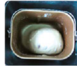
4. Формирование тестовой заготовки-колобка