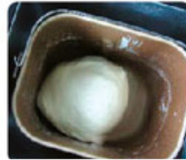
3. Предварительный замес